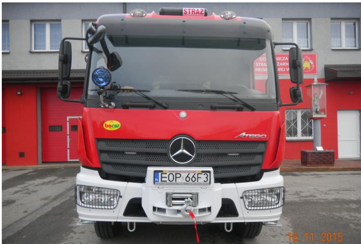
Samochód ratowniczo-gaśniczy dla OSP w Prymusowej Woli