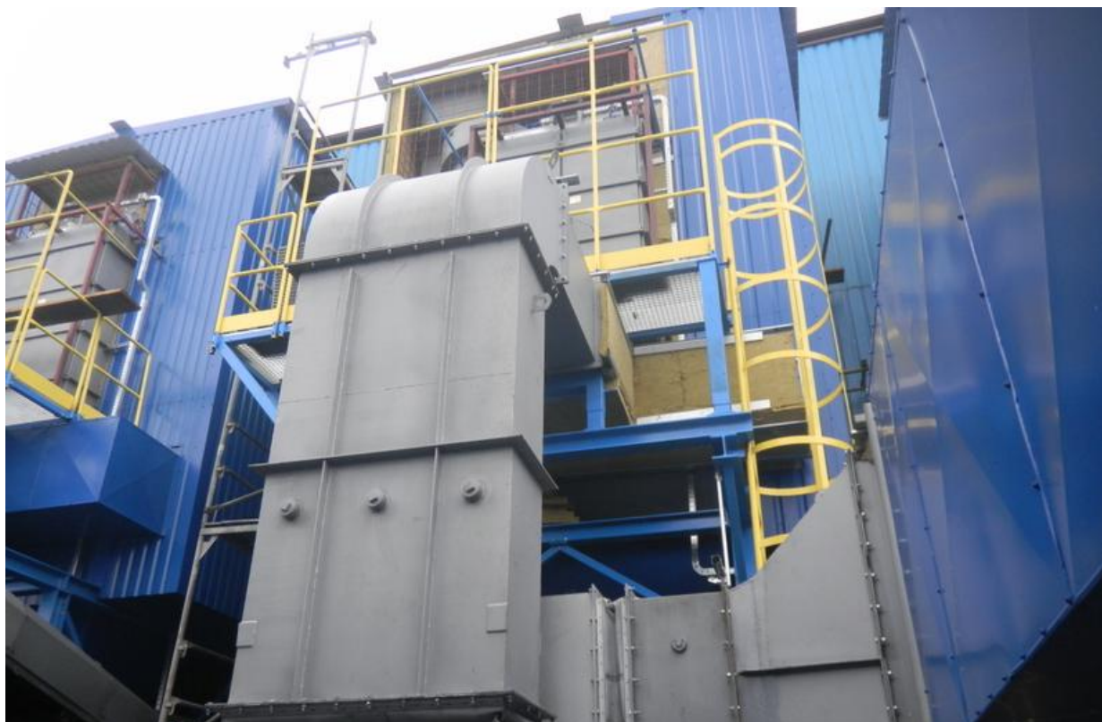
Instalacja odpylania spalin w kotłowni budynków Spółdzielni Mieszkaniowej „Przodownik” w Tomaszowie Mazowieckim