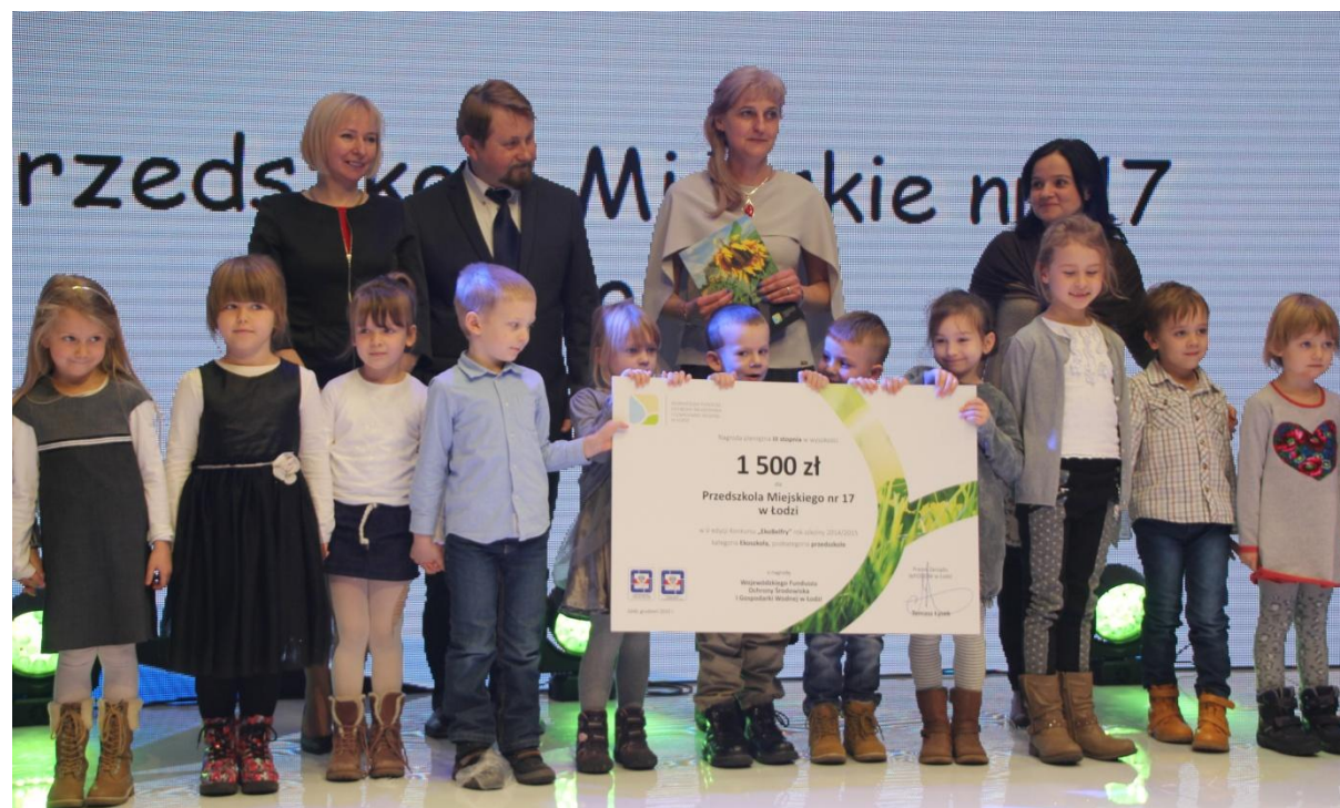
Gala podsumowująca Konkursy ogłaszane przez WFOŚiGW w Łodzi w 2015 r.