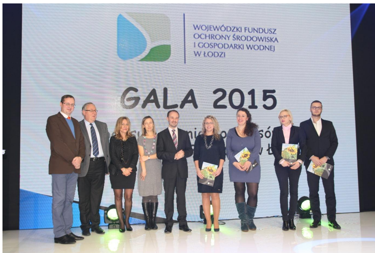
Gala podsumowująca Konkursy ogłaszane przez WFOŚiGW w Łodzi w 2015 r.