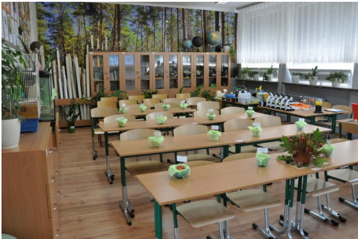
Ekopracownia w Szkole Podstawowej nr 1 w Żychlinie