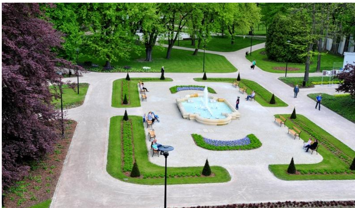
Park im. J. Słowackiego w Pabianicach - zakończenia realizacji zadania z I edycji programu priorytetowego