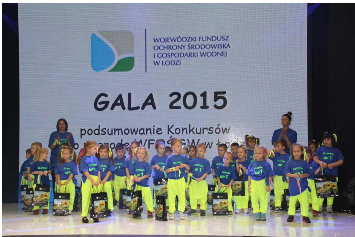
Gala podsumowująca Konkursy ogłaszane przez WFOŚiGW w Łodzi w 2015 r.