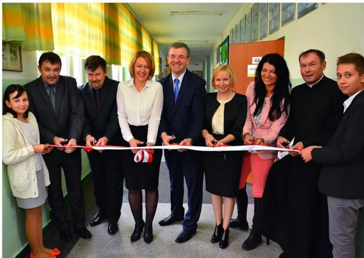
Otwarcie Ekopracowni w Gimnazjum nr 1 w Piotrkowie Trybunalskim