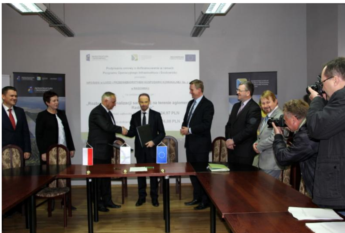
Fot. Nr 6 Podpisanie umowy POiŚ „Rozbudowa kanalizacji sanitarnej na terenie aglomeracji Radomsko” ze spółką PGK w Radomsku.

Jednym z obszarów działalności WFOŚiGW w Łodzi jest realizacja zadań związanych z pełnieniem roli Instytucji Wdrażającej Program Operacyjny Infrastruktura i Środowisko 2007-2013. Funkcja ta została powierzona Funduszowi na mocy Porozumienia z Ministrem Środowiska zawartego 25 czerwca 2007 r. (z późn. zm.). Podpisane Porozumienie służy realizacji osi priorytetowych: I „Gospodarka wodno-ściekowa” oraz II „Gospodarka odpadami i ochrona powierzchni ziemi”, dla projektów o wartości poniżej 25 milionów euro.