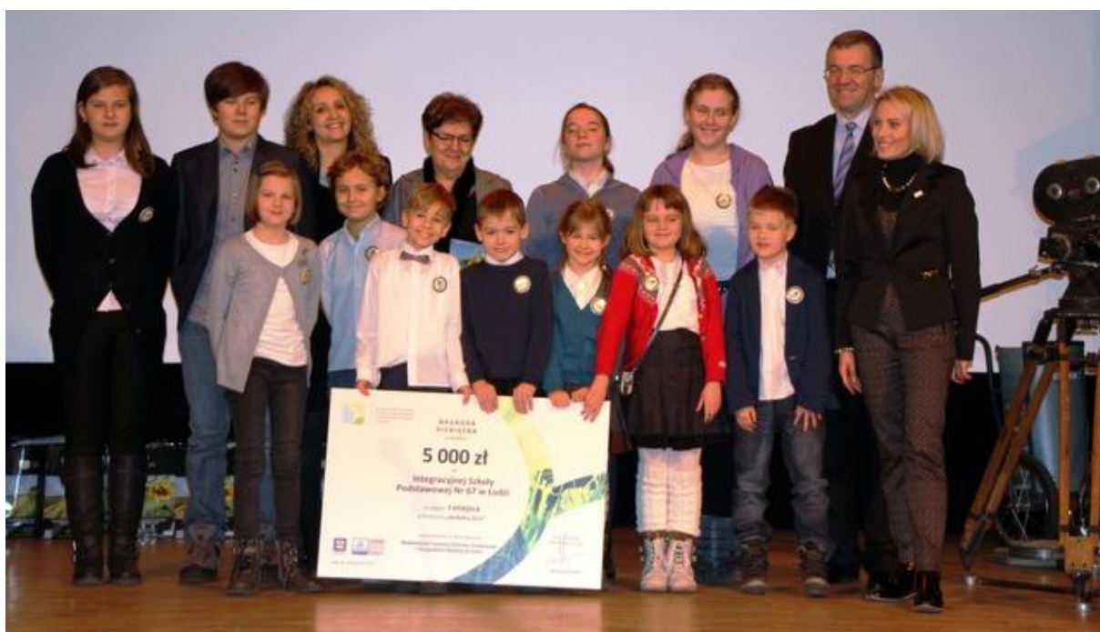
Fot. Nr 5 Wręczenie nagrody „Ekoszkola” Integracyjnej Szkole Podstawowej nr 67 w Łodzi