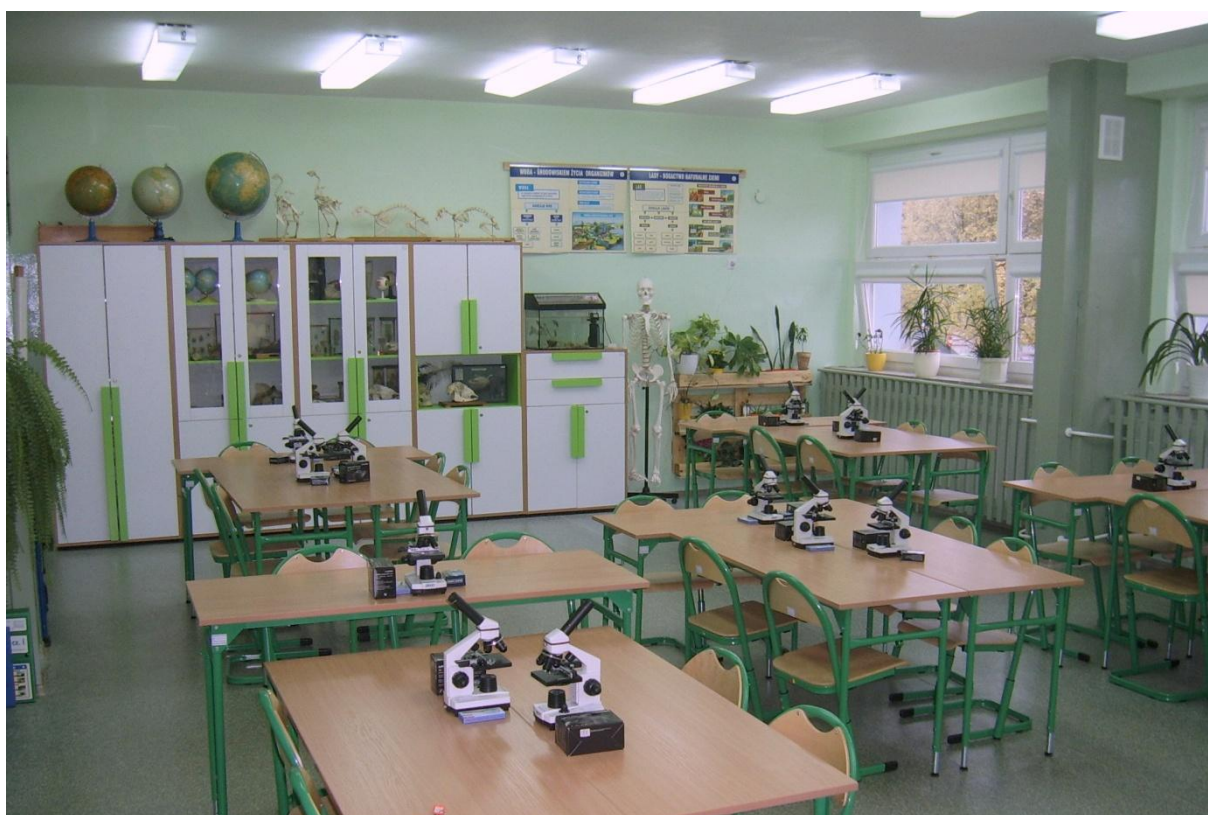
Fot. Nr 4 Nowoczesna ekopracownia w Szkole Podstawowej nr 184 w Łodzi