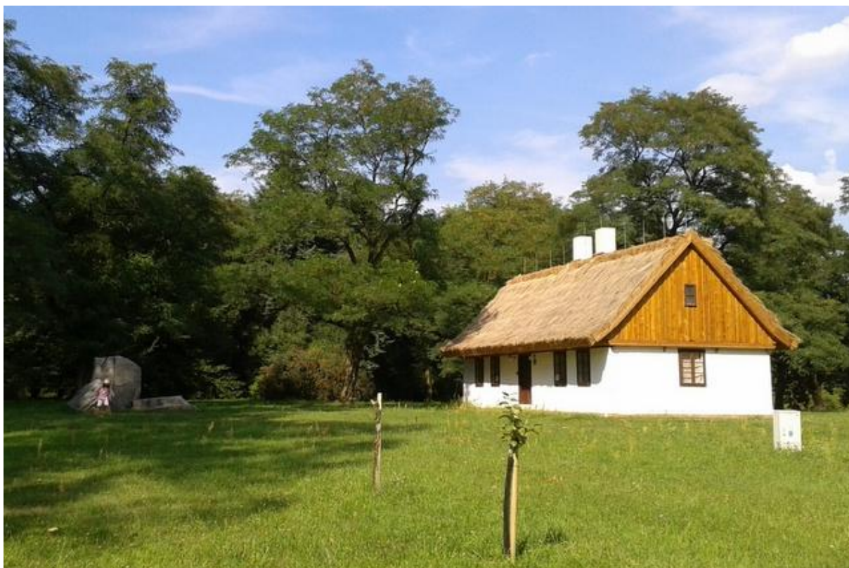
Fot. Nr 3 Skansen Roślinny w Łódzkim Ogrodzie Botanicznym