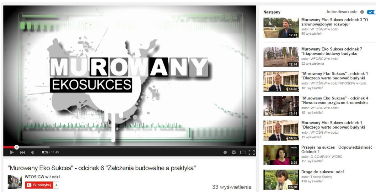
Fot. Nr 8 Kanał promocyjny Funduszu na portalu YouTube.pl

Ponadto Fundusz prowadził inne działania promocyjne, takie jak: