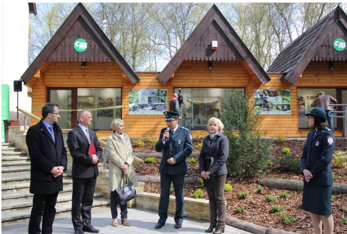
Fot. Nr 11 Otwarcie „Chaty CITES” w Miejskim Ogrodzie Zoologicznym w Łodzi

WFOŚiGW w Łodzi wchodząc w kolejną dekadę swojej działalności widzi zasadność kontynuowania edukacji ekologicznej wśród mieszkańców województwa łódzkiego. Działania prowadzone w 2014 r. świadczą o rosnącej z każdym kolejnym rokiem roli Funduszu jako ważnego partnera w finansowaniu działań proekologicznych w regionie. Dzięki szeroko prowadzonej promocji i efektywnej współpracy z beneficjentami udało się zainicjować wiele ciekawych, pożytecznych i atrakcyjnych projektów oraz przeprowadzić kampanie informacyjne dotyczące możliwości uzyskania wsparcia finansowego ze środków Funduszu, jak również kampanie z zakresu edukacji ekologicznej.