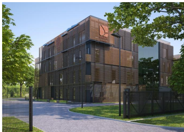
Fot. Nr 1 Widok na północno-wschodnią elewację budynku siedziby Funduszu – realizacja i projekt.

Do dnia 31.12.2014 r. (III i IV kwartał 2014 r.) wykonano między innymi: fundamenty budynku wraz ze ścianami obwodowymi, ściany i stropy, wewnętrzne i zewnętrzne ściany murowane, podkonstrukcje stalowe na dachu, okna aluminiowe zewnętrzne, system dolnego źródła ciepła i instalacji zewnętrznej, zbiorniki retencyjne kanalizacji deszczowej, instalację kanalizacji sanitarnej zewnętrznej oraz przyłącze wodociągowe.