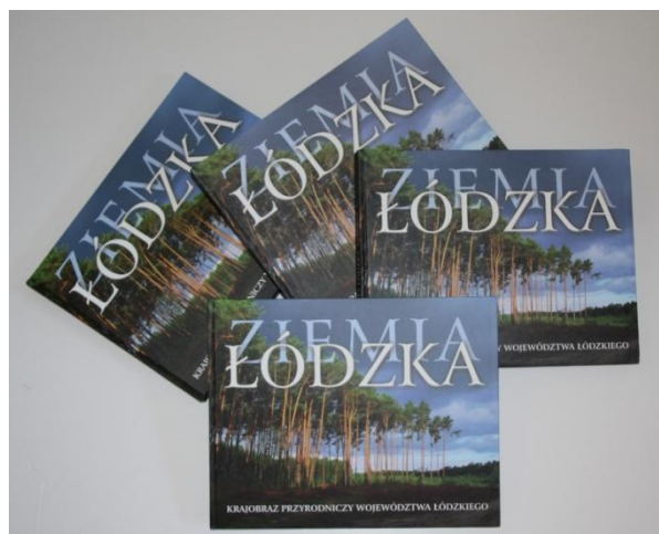
Fot. Nr 7 Publikacje promocyjne Funduszu

W 2014 roku wyemitowano na antenie TVP SA Oddział Terenowy w Łodzi cykl 7 odcinków programu "Murowany Eko Sukces", którego celem było m.in. zaprezentowanie oferty WFOŚiGW w Łodzi mieszkańcom województwa łódzkiego, upowszechnienie dobrych praktyk w zakresie budownictwa przyjaznego środowisku oraz promocja wiedzy na temat efektywności wykorzystania energii z odnawialnych źródeł. Emitowany w tak zwanym „prime time” tj. w godzinach największej oglądalności, program cieszył się dużym zainteresowaniem widzów. To kolejny przykład działań łączących promocję oferty Funduszu wraz z edukacją ekologiczną.