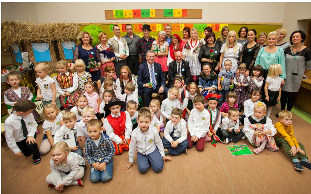
Fot. Nr 2 Podsumowanie Projektu Ekologicznego pt: "Poznajemy świat przyrody przez zabawę i doświadczenia" w Przedszkolu Samorządowym nr 5 w Bełchatowie

Dofinansowanie tego typu zadań dotyczyło powszechnej, szkolnej oraz pozaszkolnej edukacji ekologicznej, realizowanej przez: przedszkola, szkoły wszystkich szczebli nauczania, jednostki samorządu terytorialnego, ośrodki kultury, parki krajobrazowe, nadleśnictwa, oraz organizacje pozarządowe m.in. Związek Harcerstwa Polskiego, Towarzystwo Przyjaciół Dzieci, Polskie Towarzystwo Schronisk Młodzieżowych, Polskie Towarzystwo Turystyczno-Krajoznawcze oraz fundacje, stowarzyszenia i towarzystwa. Przyznane środki wykorzystano na: zakup tablic informacyjno-dydaktycznych do prowadzenia zajęć edukacyjnych, nagrody w konkursach, zakup pomocy dydaktycznych oraz wycieczki edukacyjno-ekologiczne. Dofinansowane zadania miały na celu wykształcenie prawidłowych postaw proekologicznych, wrażliwości na otaczającą naturę oraz jej różnorodność.