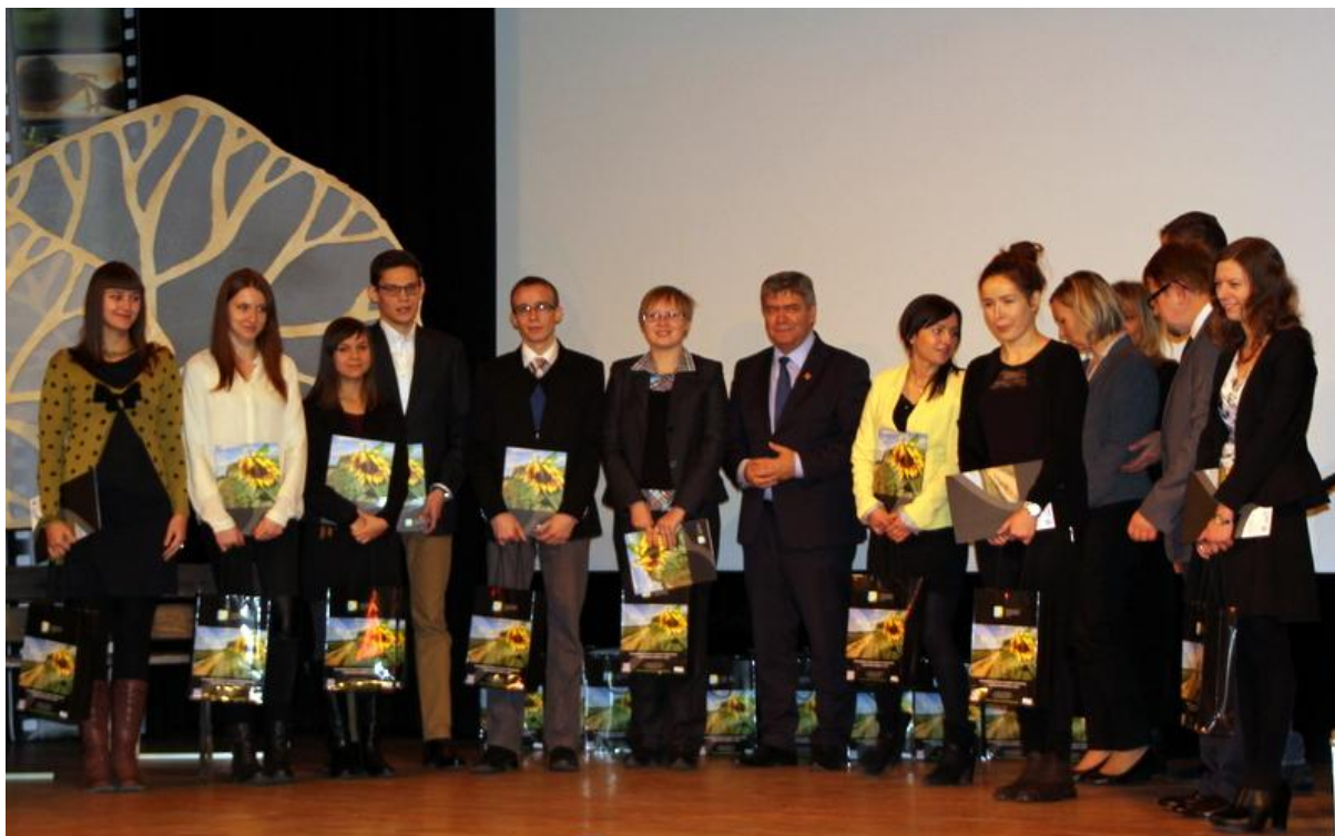
Fot. Nr 10 Marszałek Województwa Witold Stępień wręcza nagrody doktorantom i studentom podczas Gali w Łódzkim Domu Kultury