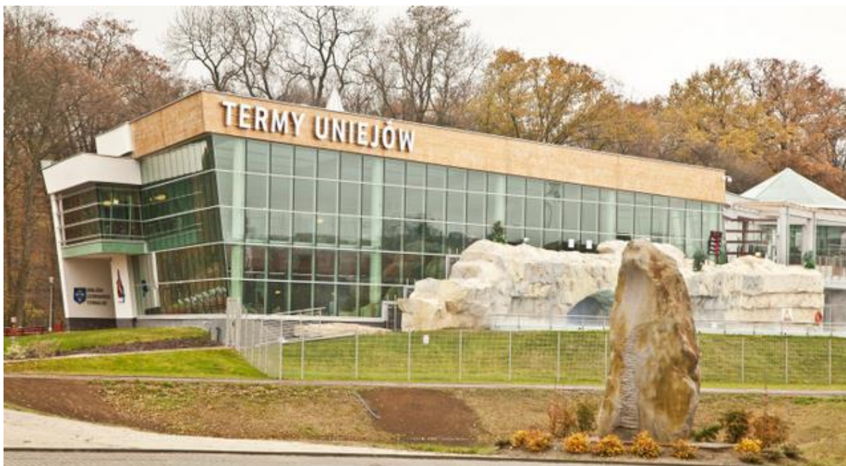
Zdjęcie nr 4 Budynek „Term Uniejów”